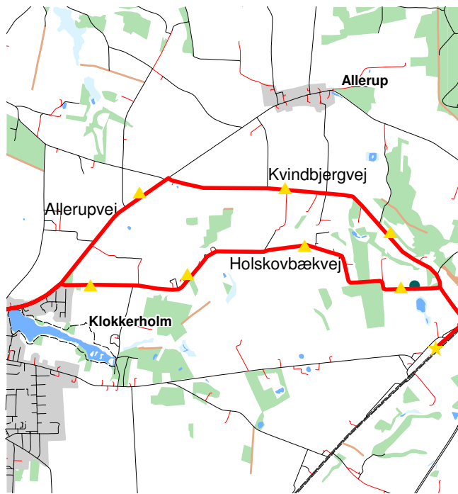
▲ Ruten er markeret med gule trekkanter.